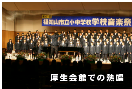
厚生会館での熱唱

歌の練習は、一週間か二週間ぐらい前から始めていたので、まあまあ自信はあったけど、もしかしたら、本番は、緊張して、他のパートの人とずれてしまふんじゃないかと思つて、不安がありました。