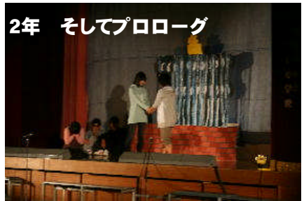
2年 そしてプロローグ