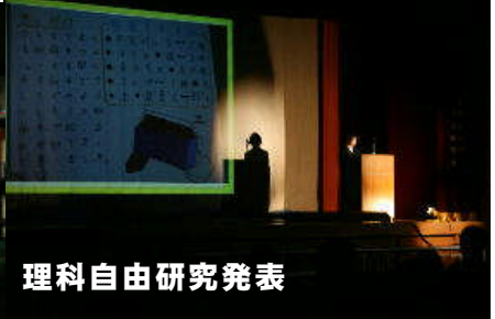
理科自由研究発表