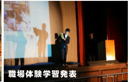
職場体験学習発表